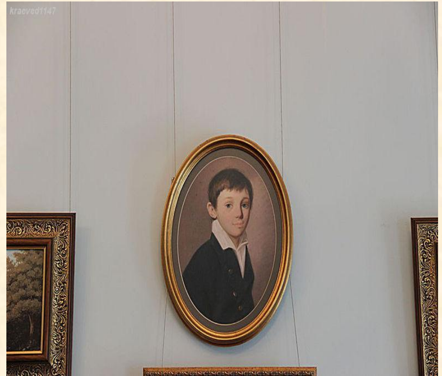
Детский портрет поэта

В комнате, где когда-то находилась столовая, посетителей ждёт знакомство с детскими и юными годами Евгения Абрамовича.