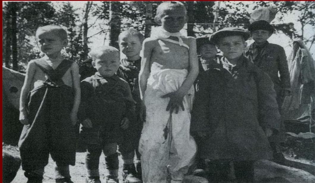
eine Gruppe russischer Buben, die auch wochenlang gehungert haben- Группа русских, голодавших неделями, мальчиков... ВН 49